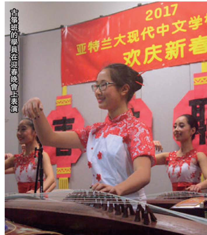
古箏班的學員在迎春晚會上表演